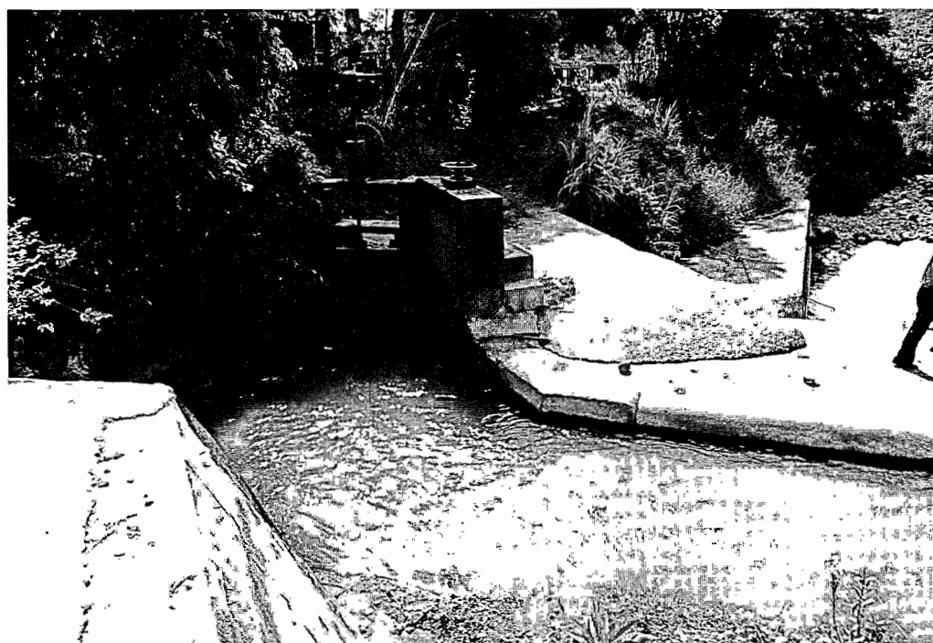
大林圳進水口（取水自倒孔山溪）