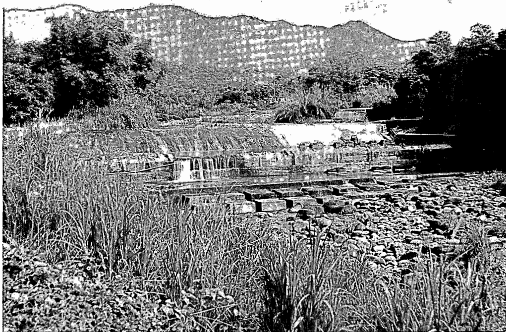
大林圳水源華興溪（又稱倒孔山溪）